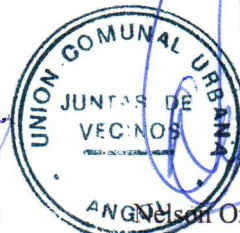
Mónica Opazo Cancino