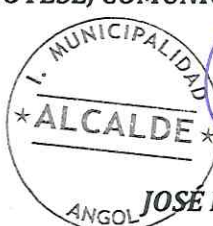
JOSÉ ENRIQUE NEIRA NEIRA ALCALDE ALCALDE DE LA COMUNA