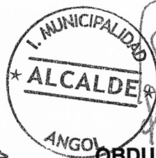
OBDULIO VALDEBENITO BURGOS