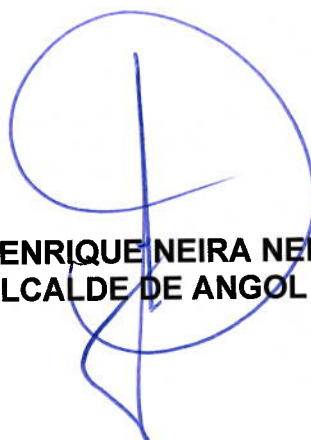
JOSÉ ENRIQUE NEIRA NEIRA ALCALDE DE ANGOL