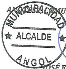
JOSÉ ENRIQUE NEIRA NEIRA ALCALDE COMUNA DE ANGOL