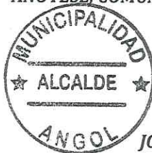
JOSÉ ENRIQUE NEIRA NEIRA ALCALDE COMUNA DE ANGOL