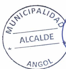
JOSÉ ENRIQUE NEIRA NEIRA ALCALDE DE ANGOL