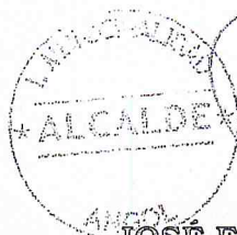
JOSÉ ENRIQUE NEIRA NEIRA ALCALDE DE ANGOL