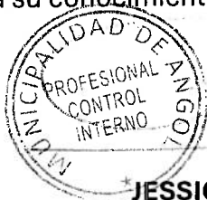
JESSICA VILLA POLANCO PROFESIONAL DE CONTROL INTERNO

Lo anterior, para su conocimiento, fines y resoluciones pertinentes.