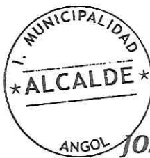
JOSÉ ENRIQUE NEIRA NEIRA ALCALDE COMUNA DE ANGOL