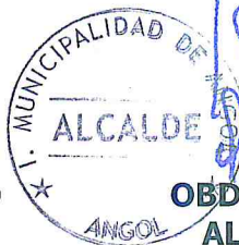
ABDULIO VALDEBENITO BURGOS ALCALDE COMUNA DE ANGOL