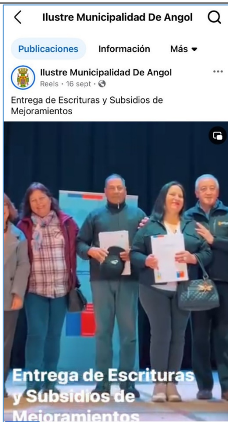
Imagen capturada de Facebook de la Municipalidad de Angol, sobre entrega de subvenciones.