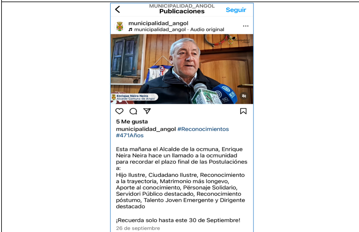
Imagene capturada de Instagram de la Municipalidad de Angol, sobre postulaciones a hijo ilustre, reconocimiento trayectoria, matrimonio longevo, entre otros.