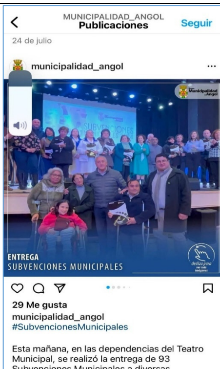
Imagen capturada de Instagram de la Municipalidad de Angol, sobre entrega de subvenciones.