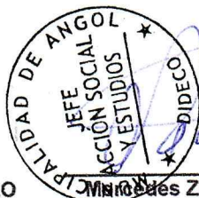
Minerva Zapata Lican JEFA DE ACCIÓN SOCIAL Y ESTUDIOS