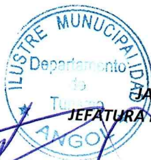
JAVIER IBAR MUÑOZ JEFATURA DEPTO. TURISMO/CULTURA