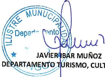
JAVIER BAR MUÑOZ JEFE DEPARTAMENTO TURISMO, CULTURA Y DEPORTE