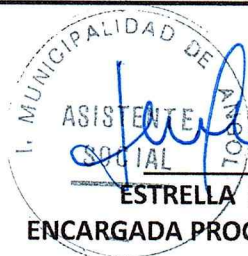
ESTRELLA SUAREZ ZARABIA ENCARGADA PROGRAMA DISCAPACIDAD