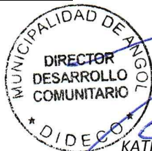
KATIA GUZMÁN GEISSBÜHLER CNI. N° [REDACTED]