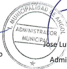
Jose Luis Bustamante Oporto