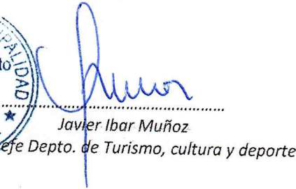
Javier Ibar Muñoz efe Depto. de Turismo, cultura y deporte