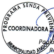
Paola Clavelle Fuenzalida