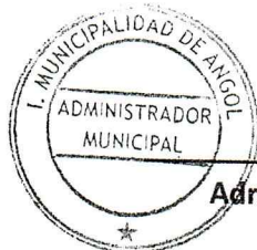
[Firma manuscrita] Administrador Municipal