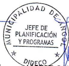
VÍCTOR GALLEGOS CEA JEFE PLANIFICACIÓN Y PROGRAMAS